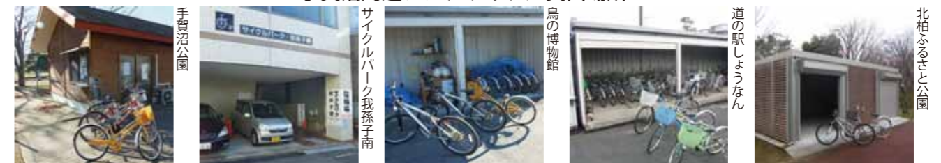
我孫子駅周辺（拡大図 B）