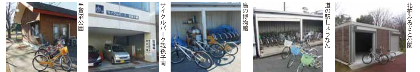
我孫子駅周辺（拡大図 B）