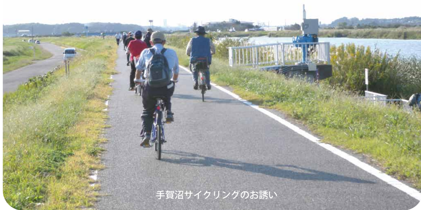
手賀沼サイクリングのお誘い